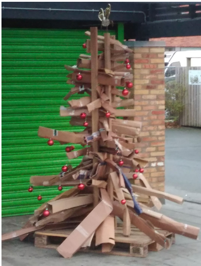
Julekunst i Hørgårdens nærgenbrugsstation